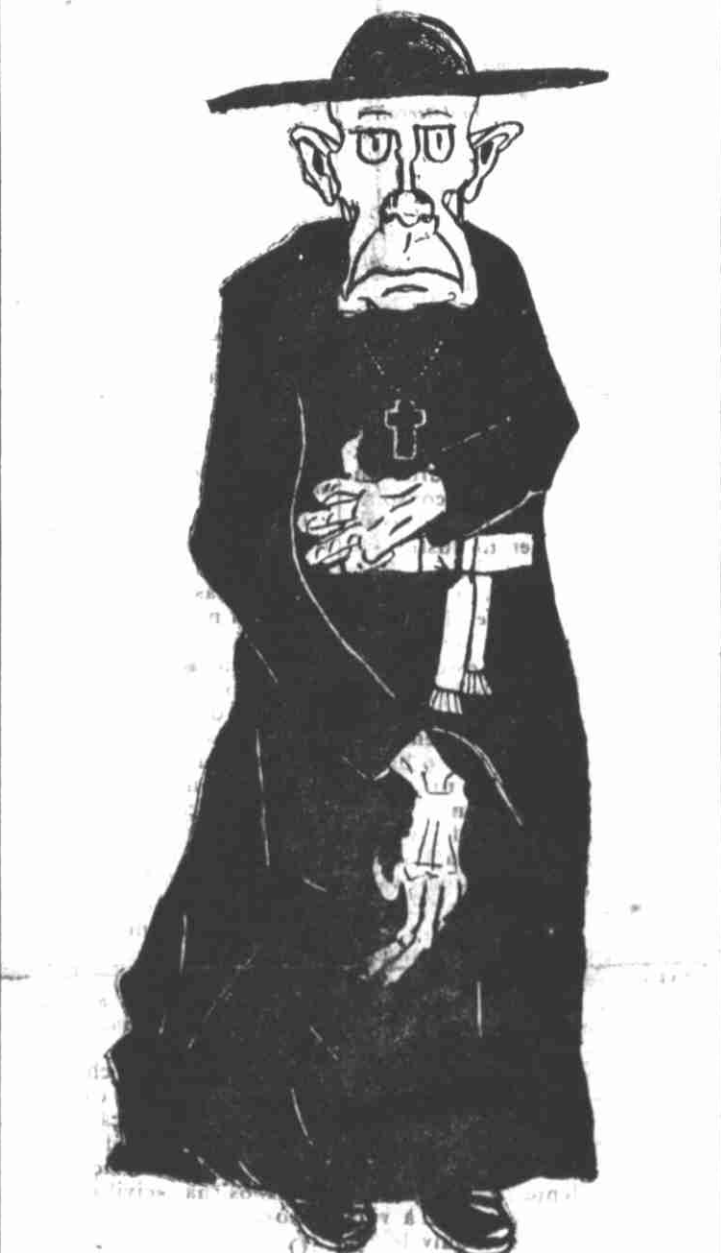
— Tremei, ó vós que ousastes pôr em dúvida a santidade dos Faustinos!...

(O APOCALIPSE HA DOIS MIL ANOS E O PROFETA JULIO NO SÉCULO XX).